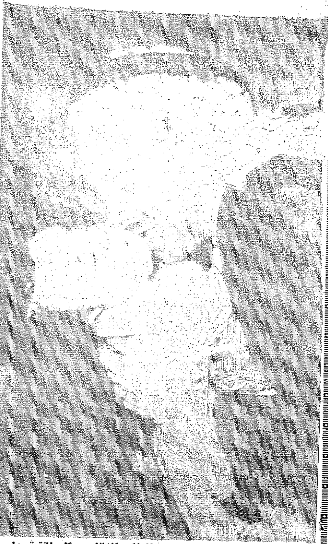
بعض ضحايا الجريمة الإسرائيلية البشعة: نساء واطفال وشيوخ فاجأهم العدوان الهموم وتامون آمنون نسي مزارعهم